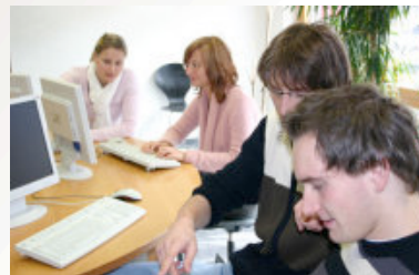
Die Multimedia-Bibliothek mit angeschlossenem Internetcafe

Ferner ist im 2. Ausbildungsjahr eine Projektarbeit mit berufstypischer Aufgabenstellung zu erstellen!